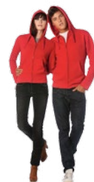
B&C Hooded Full Zip /women & /men